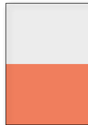
1/2 Seite quer 210 x 145 mm